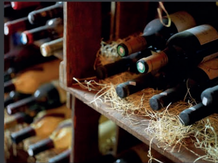
Ein gut sortiertes Wein- und Spirituosenangebot sowie antialkoholische Getränke stehen zur Verfügung.